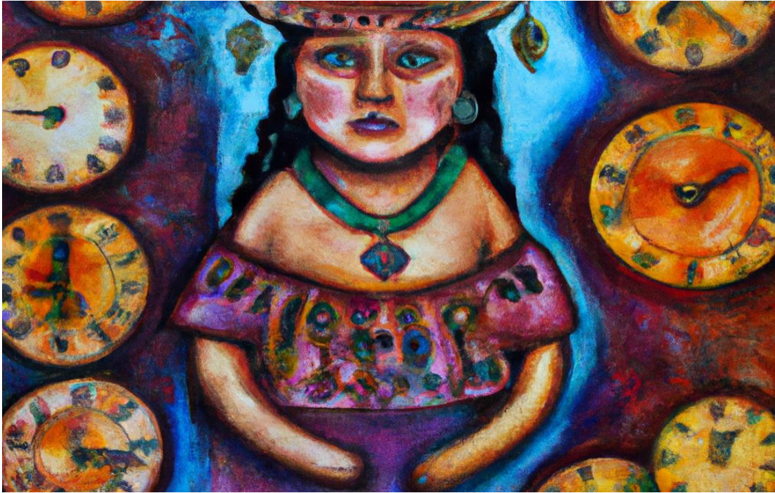
El tiempo y Semiótica. Imagen generada con Dall-E 2 de OpenAI.