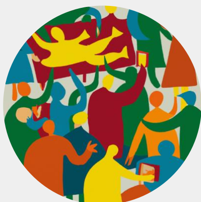
Contribución. Imagen generada con Dall-E 2 de OpenAI.