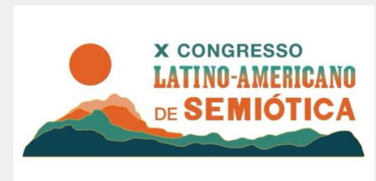
X Congreso de la Federación Latinoamericana de Semiótica: Semiótica del futuro, futuro de la semiótica.

Ante la incertidumbre y la imprevisibilidad del futuro, la semiótica se abre a cuestiones transtemporales y se enfoca en investigar y prever los dilemas futuros. Además, en un mundo cambiante, la semiótica reflexiona sobre sus posibilidades y limitaciones, defendiendo su lugar en el panorama comunicacional, tecnológico y humano.