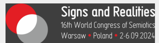
XVI Congreso Mundial de Semiótica: Signos y Realidades.

Haga clic en la imagen para acceder a la página web.