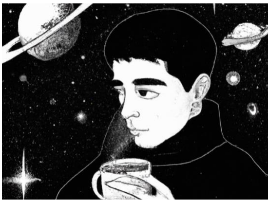
Imaginarios. Imagen generada con Dall-E 2 de OpenAI.