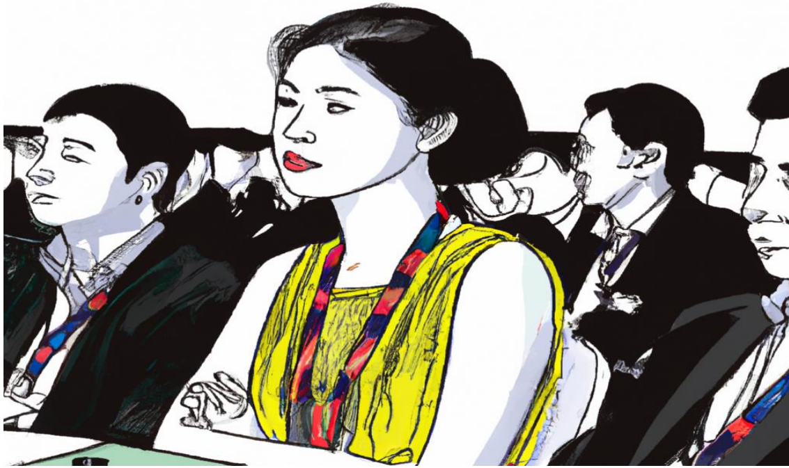
La Semiótica: Un evento académico. Imagen generada con Dall-E 2 de OpenAI.