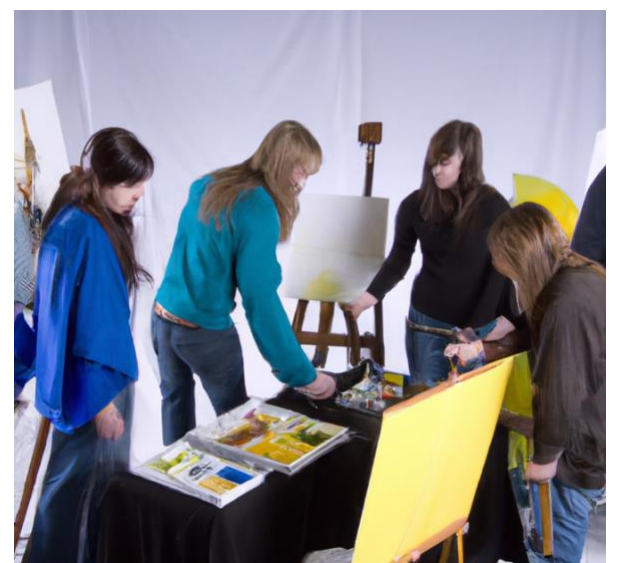
El consenso. Imagen generada con Dall-E 2 de OpenAI.

Esto es, una producción semiótica y discursiva por parte de un grupo social, expresada a través del arte, la moda o la tecnología, por ejemplo, construye los objetos semióticos. Es la interpretación de estos los que constituirán un mundo posible que represente una mejora en algún ámbito de la existencia humana que pueda revelar las problemáticas en el mundo actual, con lo cual el grupo podrá constituir un imaginario alterno contrahegemónico al impuesto en la realidad. Es decir, al unir las expresiones de los mundos posibles con los imaginarios, estos no solo sirven como una interpretación del mundo actual, sino del mundo que podría ser.