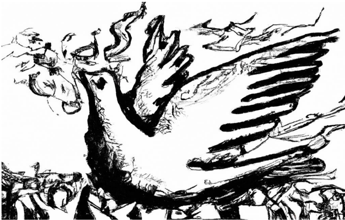
La paloma de paz siendo destruída. Imagen generada con Dall-E 2 de OpenAI.