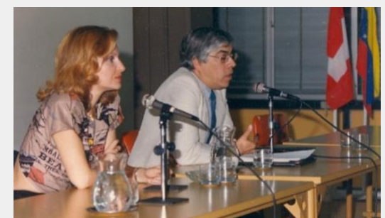
II Congreso Internacional Latinoamericano de Semiótica.