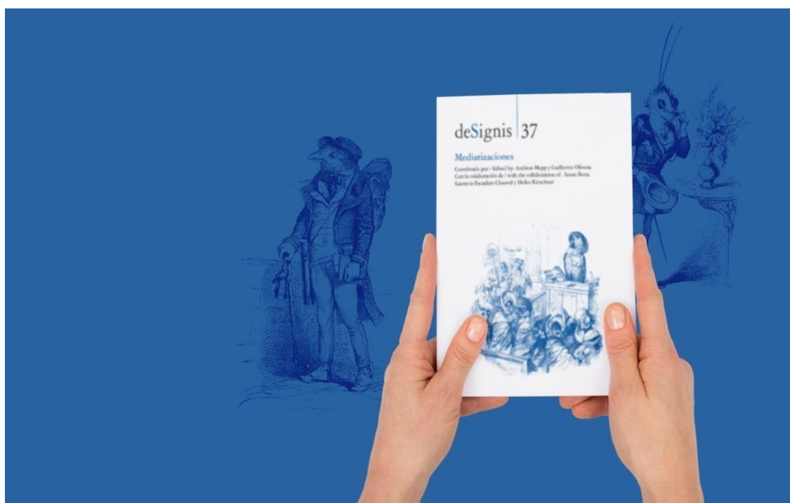
Número 37: Mediatizaciones.